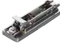
DUOMATIC SM Menteşe tabanı